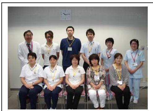
研修 1 日目当院への参加者