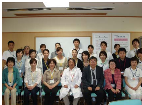
2 日目小浜病院のスタッフと研修生