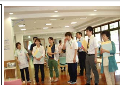
維持期の老健施設から自宅 復帰への取り組みを学ぶ