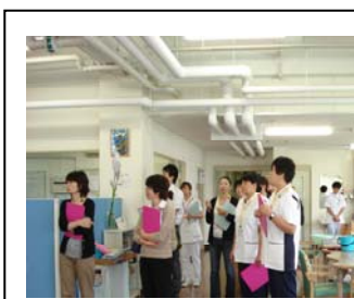
2 日目の院内見学 公立新小浜病院リハ室 で回復期の取組を知る