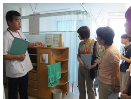
多職種での情報共有の説明