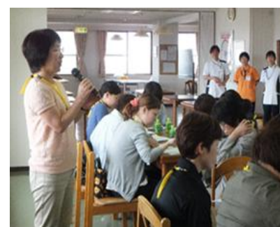
見学グループごとに感想を発表