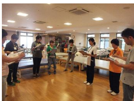
通所リハビリでは季節行事や楽しみながらできるプログラムを計画