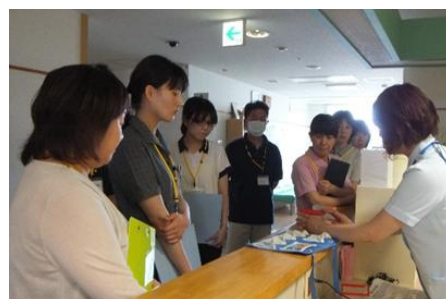
内服薬の管理について説明