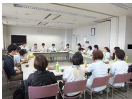
ランチョンミーティングで情報交換