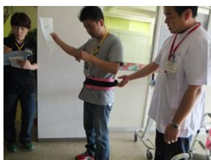
安全で優しい各種用具の体験中