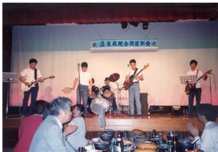
写真1：2001年3月 合同送別会

2000年4月私は外科医として島原病院に赴任し、その年の終り頃、雑談の中で「バンド作ってコンサートやりたかね！いつやる？」みたいな話が出ました。メンバーは医師、看護師、事務だったと記憶しています。問題はいつやるか？患者さんの前で演奏するには自信ないし、まずは院長がOKというか……。結局病院の送別会ですることになりました。どんな曲をやるかがもう一つの問題で、ベンチャーズ、ビートルズ、サザンオールスターズ……。それぞれ好みの曲を出し合い、選曲会議を行いました。練習は、騒音被害を考え旧病院（温泉病院）入口前の講堂で行い、2001年3月の合同送別会（写真1）でAZUMA BANDがデビューしました。送別会ではみんなが楽しい時間を過ごせたと思います。人事異動でメンバーは変わりつつも年一回の送別会で演奏を続けました。